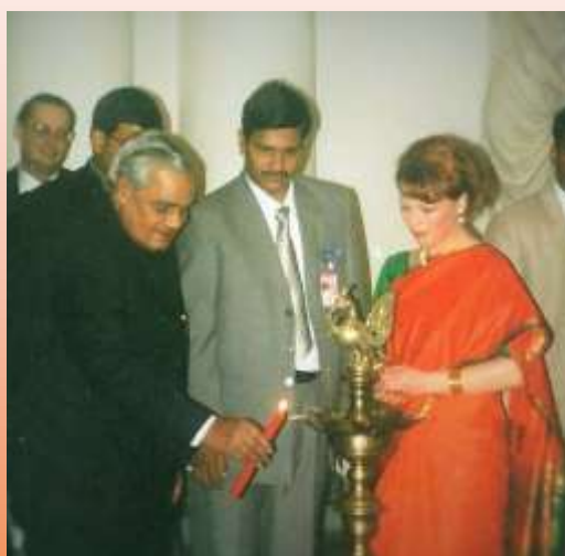
Мандира с премьер-министром Индии

Постоянно находится в творческом поиске, каждый раз раскрывая храмовые искусства с нового ракурса, вызывает неослабевающий интерес у учеников и публики, приходящей на ее выступления и на обучение в школу.